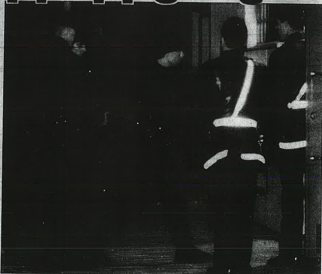
SPECIALSTYRKAN SPÄRRADE AV Enligt polisen var fembarnsmamman troligen på väg upp till sin lägenhet när hon kallblodigt sköts ihjäl.